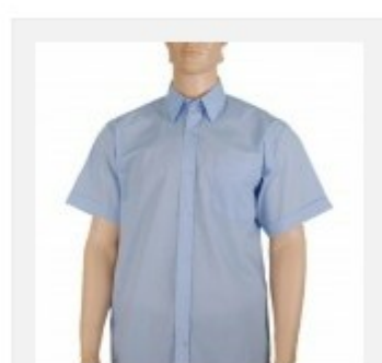
Koszula męska krótki rękaw