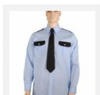
Koszula służbowa męska