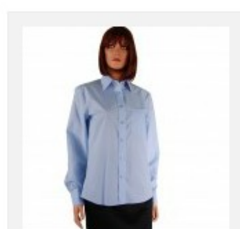
Koszula damska długi rękaw