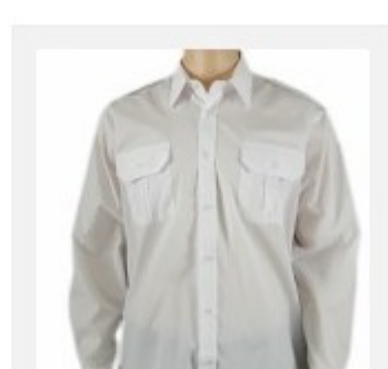
Koszula służbowa męska