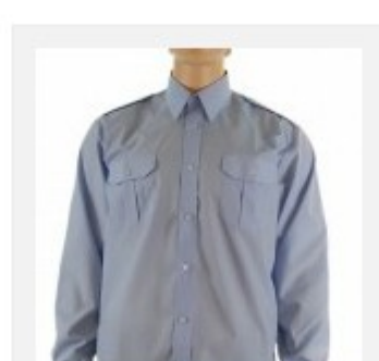
Koszula służbowa męska