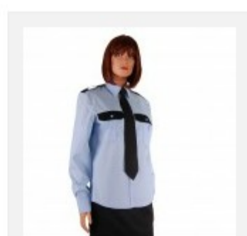
Koszula służbowa damska