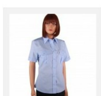
Koszula służbowa damska