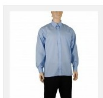
Koszula męska długi rękaw