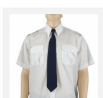
Koszula męska służbowa