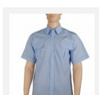
Koszula służbowa męska