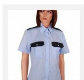
Koszula damska krótki rękaw