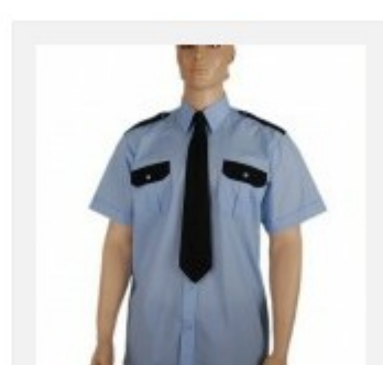
Koszula męska krótki rękaw